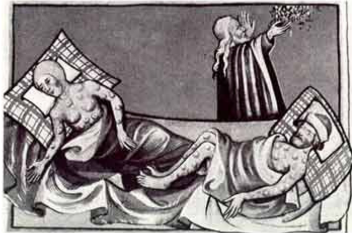
Hình minh họa dịch bệnh "Cái chết đen" trong cuốn kinh Toggenburg (1411)

Tên gọi “Cái chết đen” được gán cho bệnh dịch là bởi, thay vì những nốt sùng bạch hạch, khắp người bệnh nhân nổi lên đốm đen. Quái ác hơn, nó là sự tổng hợp của 4 dạng dịch bệnh chết người: dịch hạch, sốt thương hàn, nhiễm trùng máu và viêm phổi.