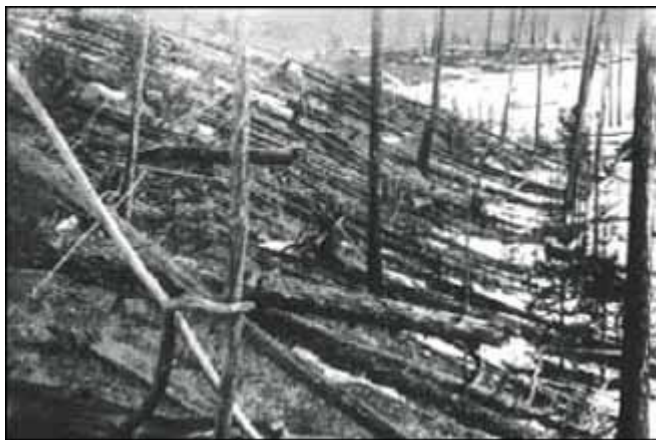
Cánh rừng vẫn chết 20 năm sau vụ nổ Tunguska

7 giờ 17 phút ngày 30/6/1908, vụ nổ mang sức nặng 15 triệu tấn (gấp hơn 1.000 lần quả bom nguyên tử ở Hiroshima) đã san bằng 1 vùng rộng lớn có bán kính gần 92 km thuộc khu vực Tunguska, Serbia. Những khung cửa kính cách đó 650 km cũng vỡ vụn vì rung chuyển.