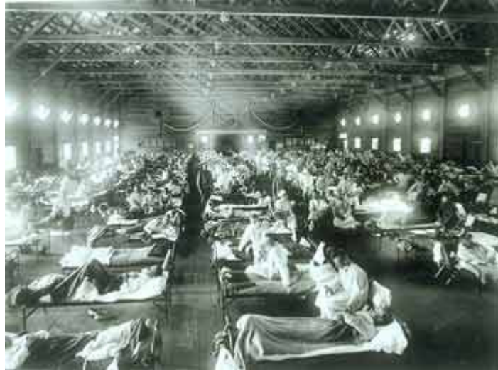
Bệnh nhân cúm năm chạt cứng bệnh viện Funston, bang Kansas (Mỹ)

Một phần năm dân số thế giới đã nhiễm bệnh, con số tử vong ước chừng 40 triệu người - còn cao hơn cả số người chết trong 4 năm đại chiến. Ngay cả Woodrow Wilson - Tổng thống thứ 28 của Hoa Kỳ - cũng chết vì căn bệnh này sau khi trở về từ Hội nghị Hòa bình ở Versailles.