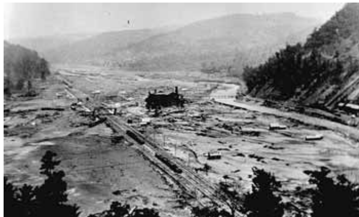
Hậu quả cơn đại hồng thủy để lại cho thị trấn Johnstown năm 1889

Hồ Conemough nằm cách thị trấn Johnstown, bang Pennsylvania (Mỹ) một đoạn dài hơn 2 chục cây số. Ngày 31/5/1889, sau 2 ngày mưa thối đất thối cát, thảm họa ập xuống khi con đập giữ nước hồ không đủ sức chịu đựng, vỡ tung.